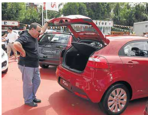
Un usuario observa un coche en un stand de la Feria.